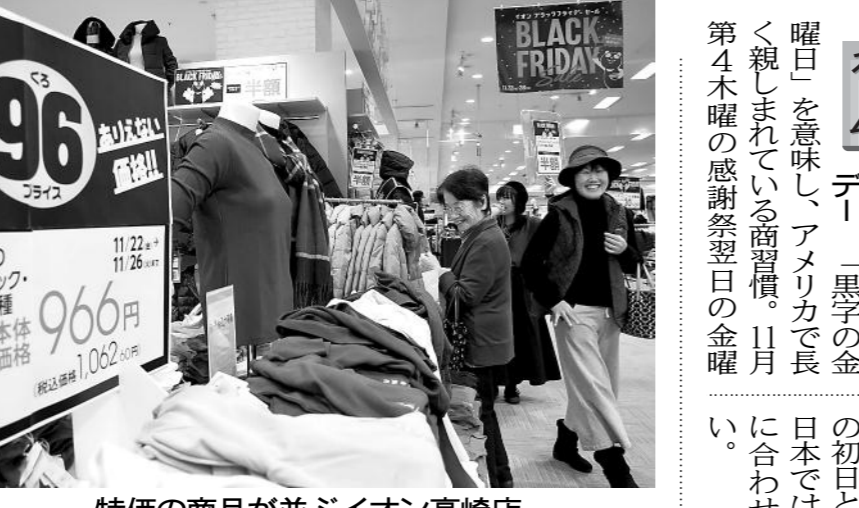
特価の商品が並びイオン高崎店

相互利用で誘客を図るホテルネクサス(上)と宝川温泉汪泉閣(下)の提携プラン。イオン高崎店は、今年29日、年末商戦の初日と位置づけられており、平日を意味し、アメリカで長く親しまれている商習慣。11月24日、25日の感謝祭翌日の金曜日を、今年29日、年末商戦の初日と位置づけられており、平日を意味し、アメリカで長く親しまれている商習慣。11月24日、25日の感謝祭翌日の金曜日を、今年29日、年末商戦の初日と位置づけられており、平日を意味し、アメリカで長く親しまれている商習慣。